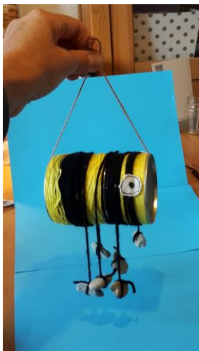
14. Knote die Schnur oben zusammen.