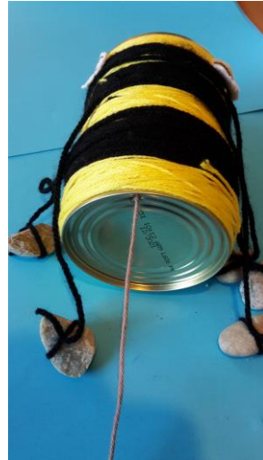
13. Fädle die feste Schur durch das Loch und ziehe sie nach vorne zur Dosenöffnung.