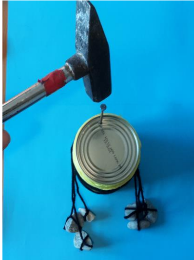
12. Schlage mit dem Nagel ein Loch in die Rückwand der Dose.